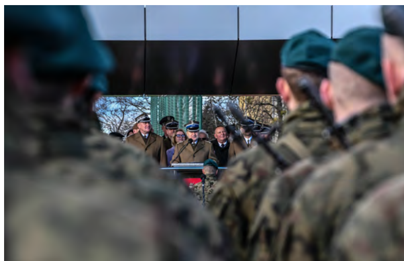
fot. 10. Wrocławska Brygada Łączności

Wydarzenie miało szczególny wymiar, gdyż pożegnano nie tyl-