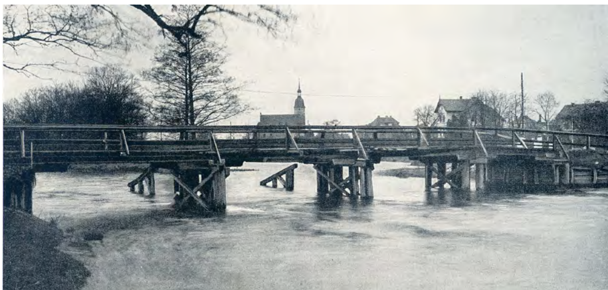
Istniejący do 1934 r. most Złotnicki o konstrukcji drewnianej na tle zabudowy Bergiusstrasse (ul. Skoczylasa) wraz z kościołem staroluterańskim (obecnie nieistniejącym); widok w kierunku północno-zachodnim, zdjęcie sprzed rozbiórki mostu.

W takiej formie przetrwały prawie do końca pierwszej dekady XX wieku, gdy zapadła decyzja o budowie nowej przeprawy. Nowy most, nazwany Weistrizbrücke (most Bystrzycki), został wybudowany w osi ulicy noszącej nazwę Breslauerstrasse (obecnie ul. Średzka). Został wzniesiony w latach 1909–1912 jako konstrukcja łukowa, żelbetowa, o dwóch przęsłach: to krótsze (zachodnie) przerzucono nad nurtem Młynówki (obecnie ślepa odnoga zwana Leśną), a dłuższe (wschodnie) nad głównym nurtem rzeki. Los mostu dopełnił się w lutym 1945 roku, gdy niemieccy żołnierze wysadzili go w powietrze. Odbudowany został w uproszczonych formach w latach 1946–1947, jako dwie odrębne konstrukcje, co podkreśla nazwa: mosty Średzkie – Zachodni i Wschodni.