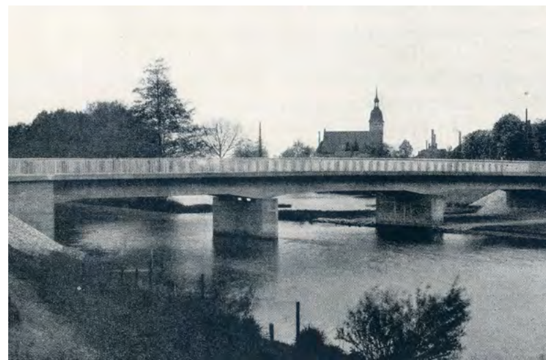
Żelbetowy most Złotnicki wkrótce po oddaniu do użytku w 1934 r.; widok w kierunku północno-zachodnim.

Mam świadomość, że niniejszy artykuł przedstawiający historię