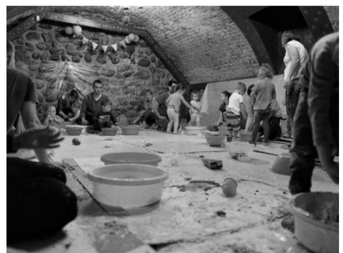
Sensoplastyka w Centrum Kultury „Zamek”