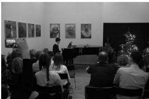
Noworoczny koncert pianistów pod opieką A. Pulkowskiej

Przypominamy, że w listopadzie 2017 roku w CK Zamek przedstawiciele sześciu Rad Osiedli (Jerzmanowo - Jarnottów - Strachowice - Osiniec, Leśnica, Maślice, Pilczyce-Kozanów-Popowice Pn., Prace Odrzańskie i Żerniki) podpisali list intencyjny w sprawie wspólnych działań. Rady, które podpisały ten list cyklicznie spotykają się, wymieniają się doświadczeniami, pomagają sobie w sprawach transgranicznych, ponadosiedlowych.